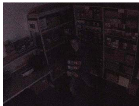
Imagem de uma câmera convencional